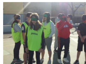
Simulación de discapacidad