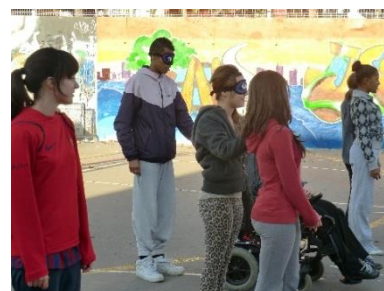
Acompañamientos con limitación visual

Tenemos tejido un engranaje sostenible, donde la comunidad educativa (alumnos desde 1º de la ESO hasta que acaban bachillerato, ampa, profesorado, familias y exalumnos), entidades locales, instituciones y medios de comunicación, colaboran de tal manera que TODOS obtienen beneficio, sin grandes necesidades de aportación económica y de recursos materiales y humanos.