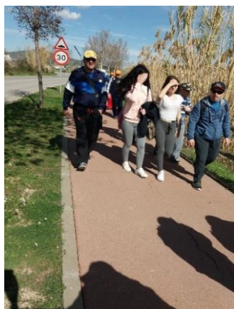
Caminando hacia la playa

- Padrino de acompañamiento vs "Godfather's Race" . Nació con una dinámica similar al "padrino de lectura", aunque actualmente busca ser una carrera de orientación a través de retos colaborativos. El alumnado de nuestro instituto se encarga de velar por los usuarios del centro ocupacional Caviga, estableciendo una relación de acompañamiento en una caminata de unos 6km hasta la playa del Remolar (Viladecans) o en una carrera de orientación en el Parque de la Marina (Viladecans).