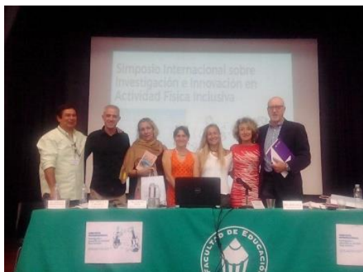
Ponentes Simposio Internacional

- en la revista digital “ Acción Motriz ” aparece un artículo sobre el Proyecto AFIN en un monográfico sobre la educación física inclusiva (n.23, junio-diciembre 2016) http://www.accionmotriz.com/documentos/revistas/articulos/23_4.pdf4