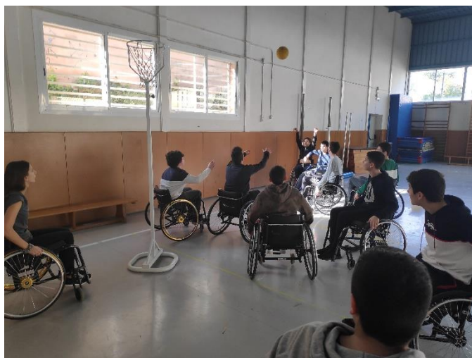
Práctica de deporte adaptado

3. Aumentar la implicación de los alumnos , llegando al momento en que reviertan sus aprendizajes sobre la comunidad educativa. Esto se conseguía dando valor a sus propuestas, logrando su autoconfianza para dirigir las actividades deportivas y propiciando su deseo de promoverlas y de formar parte del equipo de dinamizadores deportivos.