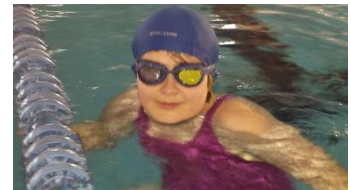
Actividades en el medio acuático