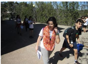
Marcha de regularidad

En tiempos pasados, se llevó a cabo un proyecto bianual, "Marcha de Regularidad", una actividad de orientación (2º y 3º), en la que colaboraban en su organización familias, profesores del centro y ex-alumnos.