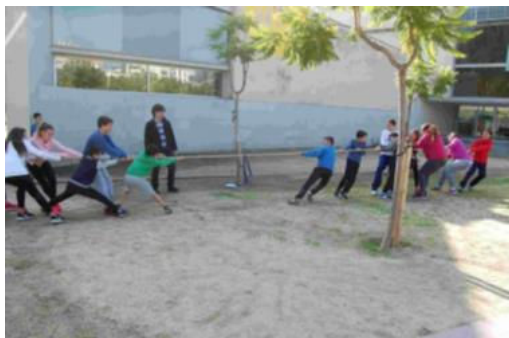
Sogatira por grupos

- Juegos en el Parque de Can Xic . Durante la primera quincena de octubre, dentro del plan de acogida del nuevo alumnado, el departamento de Educación Física propone esta salida tutorial en la que se comparten experiencias lúdicas en un parque cercano al instituto. La salida permite establecer lazos de unión entre la diferente tipología de alumnado.