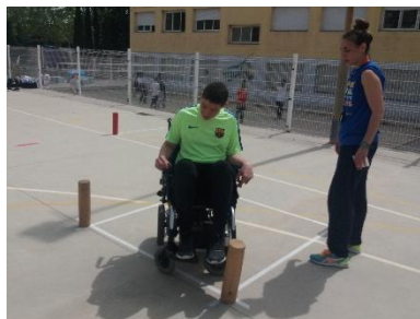
Usuario con silla electrónica

La mayoría de las actuaciones que hemos detallado llevan años realizándose, con algunos huecos debidos a los años de los recortes presupuestarios en educación. Algunas están en proceso de consolidación y otras, empezando a dar el fruto de revertir sobre el centro educativo lo que éste ha ofrecido al alumno en su formación.