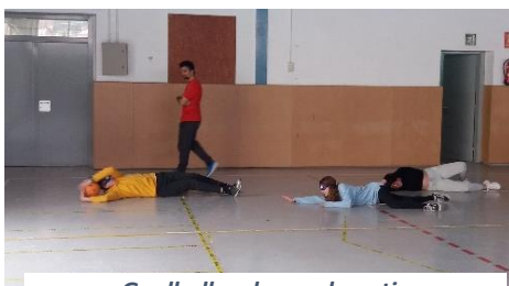
Goalball en horas de patio

Recibimos anualmente una subvención por la participación en el Plan Local del Fomento del Deporte (PLFE), impulsado por el Ayuntamiento de Viladecans, que está ligado a las acciones que se llevan a cabo en el centro en relación al fomento de la actividad física.