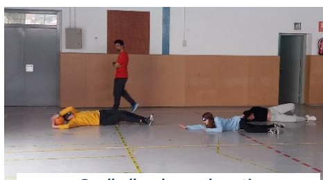
Goalball en horas de patio

Recibimos anualmente una subvención por la participación en el Plan Local del Fomento del Deporte (PLFE), impulsado por el Ayuntamiento de Viladecans, que está ligado a las acciones que se llevan a cabo en el centro en relación al fomento de la actividad física.