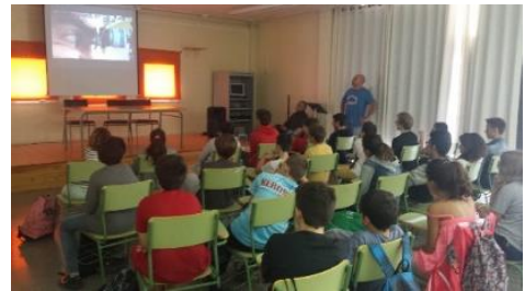
Previo al comienzo de las actividades

- Charla técnico deportivo de la ONCE . En la asignatura optativa de “actividades acuáticas” que se ha realizado durante 5 años (actualmente no hay horas para impartirla), un técnico de la ONCE explicaba las características de la natación adaptada y, apoyado por deportistas con discapacidad visual, el alumnado debatía sobre las posibilidades y dificultades que encontraban en su práctica deportiva. Aunque esta optativa ya no se lleva a cabo, la charla la hemos mantenido los años en que se ha podido.