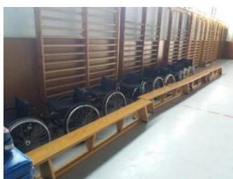
Sillas de ruedas

- Práctica de superación de barreras arquitectónicas sobre sillas de ruedas . La Diputación de Barcelona cede durante una semana, como material de préstamo, 10 sillas de ruedas a los centros docentes que lo soliciten a través del Ayuntamiento de su municipio.