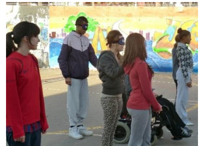
Acompañamientos con limitación visual

Tenemos tejido un engranaje sostenible, donde la comunidad educativa (alumnos desde 1º de la ESO hasta que acaban bachillerato, ampa, profesorado, familias y exalumnos), entidades locales, instituciones y medios de comunicación, colaboran de tal manera que TODOS obtienen beneficio, sin grandes necesidades de aportación económica y de recursos materiales y humanos.