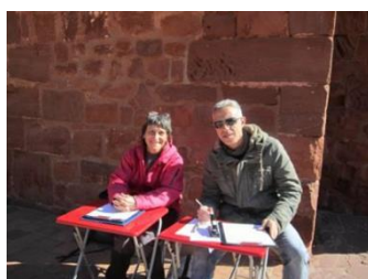
Puesto de control

- Marcha de Regularidad (en estos momentos, está pendiente de un cambio de formato). Dentro del bloque de contenidos de Actividades en la Naturaleza, el departamento de Educación Física organiza, para los niveles de 2º y 3º de ESO, una marcha a pie descriptiva con pruebas