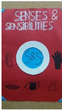
Cartel de la Jornada

- “Senses & Sensibilities” . “Senses”, por la necesidad de agudizar los sentidos, al tener dañado alguno de ellos o no tenerlo desarrollado. “Sensibilities” por las connotaciones de sensibilización que, de la práctica, se han de recoger y dar difusión. Jornada organizada con la colaboración de los estudiantes del Ciclo de Grado Superior de Actividad Física de los Gabrielistes (Viladecans) que, en forma de circuito, proponen situaciones en las que nuestros alumnos de 1º de la ESO se ponen en la piel de personas que tienen alguna función motriz o sensorial afectada. Los propios alumnos elaboran previamente los carteles de la jornada. Con posterioridad, se hace un análisis de las experiencias vividas.