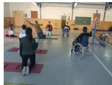
Práctica deportes adaptados

- Unidad Didáctica de deportes adaptados . Sesiones en las que el alumnado vivencia en 1ª persona las dificultades que tienen los usuarios con alguna discapacidad (actividades sin utilizar brazos, piernas o sin ver o escuchar) durante la práctica de diferentes juegos deportivos.