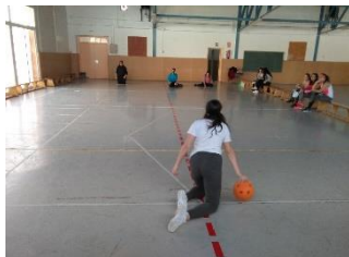
Goalball en el gimnasio

- Unidades didácticas de acrosport y salto a la cuerda . Tiene por objetivo propiciar la cohesión de grupo y la equidad a través del trabajo cooperativo, descubriendo las capacidades y limitaciones de cada uno, y adaptando las propuestas para conseguir un reto colectivo.