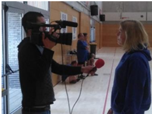
Entrevista TV Viladecans

Contactamos con diferentes entidades especializadas o no (clubs, federaciones, centros especializados en la atención a personas con discapacidad, asociaciones que dan valor a la actividad física adaptada...) y utilizamos, en la medida de nuestras posibilidades, la prensa, televisión, revistas... para difundir la idea del proyecto.