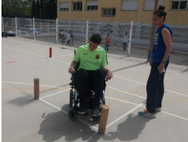
Usuario con silla electrónica

La mayoría de las actuaciones que hemos detallado llevan años realizándose, con algunos huecos debidos a los años de los recortes presupuestarios en educación. Algunas están en proceso de consolidación y otras, empezando a dar el fruto de revertir sobre el centro educativo lo que éste ha ofrecido al alumno en su formación.