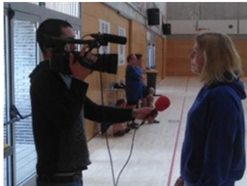
Entrevista TV Viladecans

Contactamos con diferentes entidades especializadas o no (clubs, federaciones, centros especializados en la atención a personas con discapacidad, asociaciones que dan valor a la actividad física adaptada...) y utilizamos, en la medida de nuestras posibilidades, la prensa, televisión, revistas... para difundir la idea del proyecto.